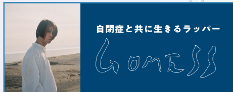
自閉症と共に生きるラッパー